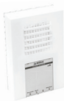
Tableau Type 4 Planète