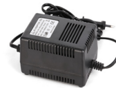
24 V CA/3 A Adaptateur d'alimentation